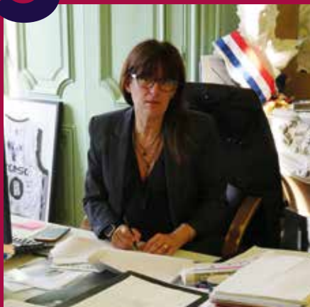
Véronique Sarselli Maire de Sainte-Foy-lès-Lyon